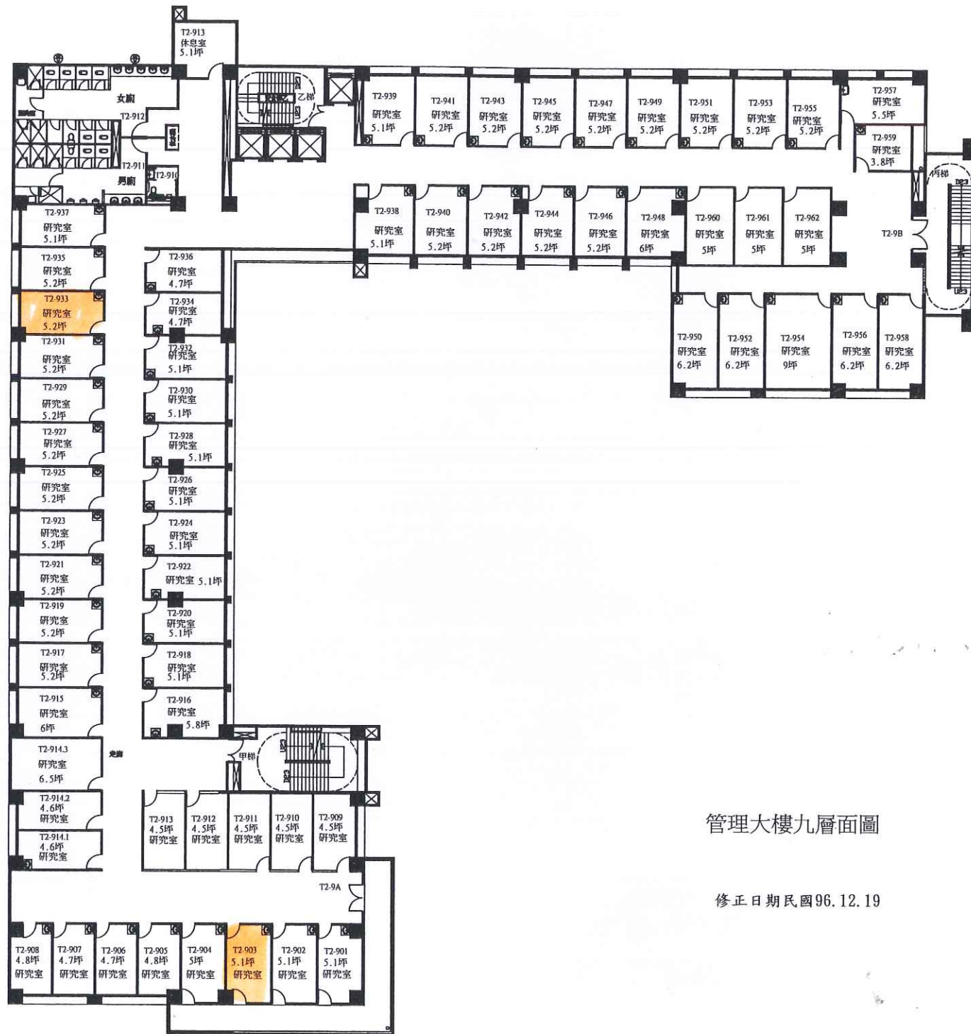
管理大樓九層面圖